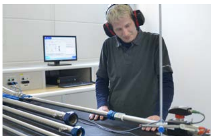
Prüfstand kritische Düsen 8 l/min – 15.000 l/min