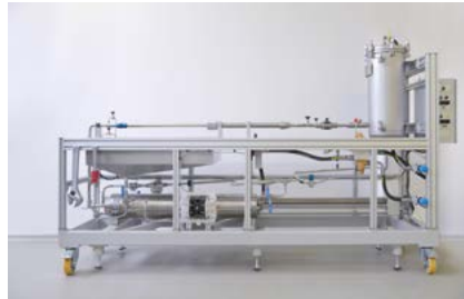
Kolbenkalibrator 10 ml/min – 200 l/min