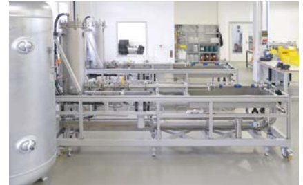
Kolbenkalibratoren (2x) 20 ml/min – 1.200 l/min

Alle vier Flüssigkeitskalibratoren basieren auf dem volumetrischen Verdrängungsprinzip mit Dichtemessung für die Umrechnung auf Massedurchfluss. Gemessen wird in einer komplett klimatisierten Umgebung von 22°C (+/-3°C).