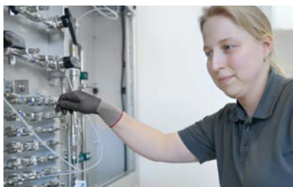
Prüfstand Laminar Flow Element (LFE) 1 ml/min – 1.000 l/min (2x)