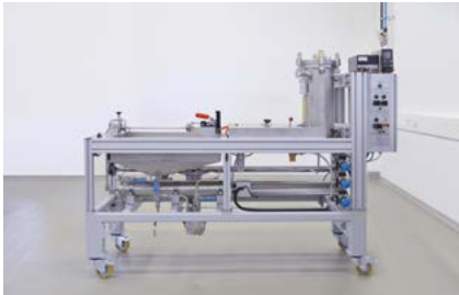
Kolbenkalibrator 0,8 ml/min – 40 l/min