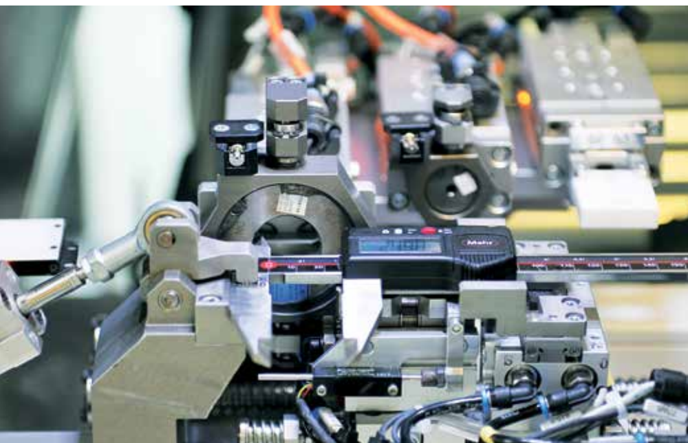
Voll automatisierte Kalibrierung von Außen-, Innen- und Tiefenmessung eines Messschiebers